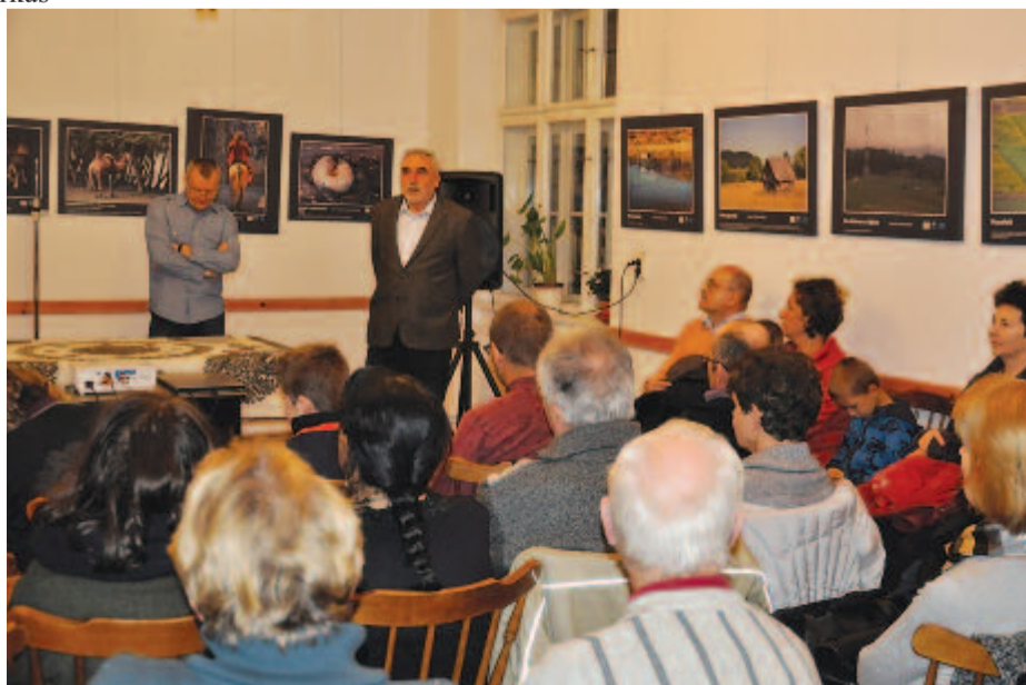
A Dersi János terem